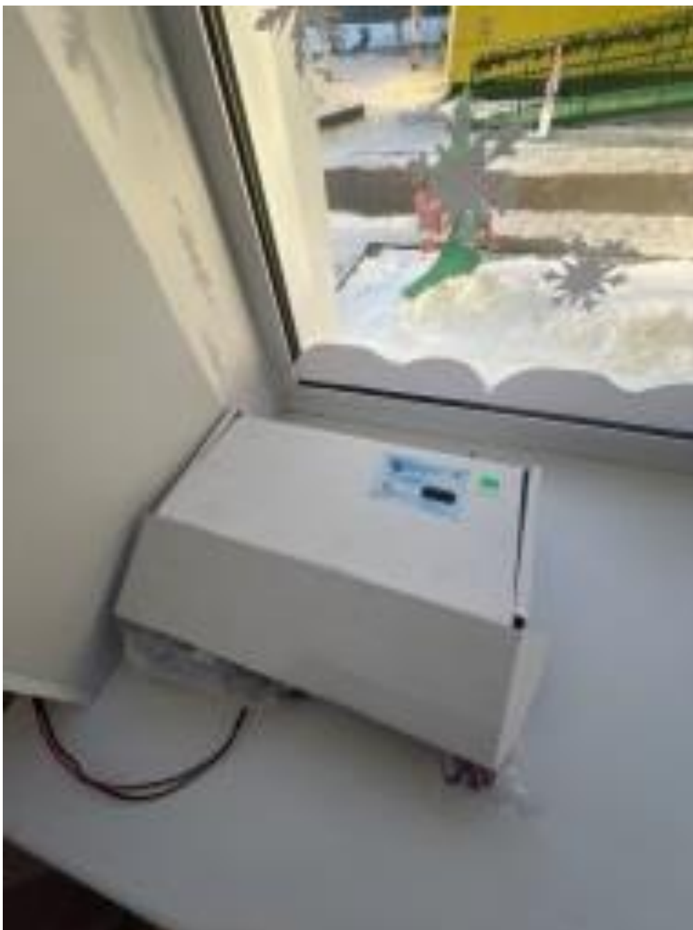
Индукционные петли и звукоусиливающая аппаратура. Ул. 40 лет Победы, 1а