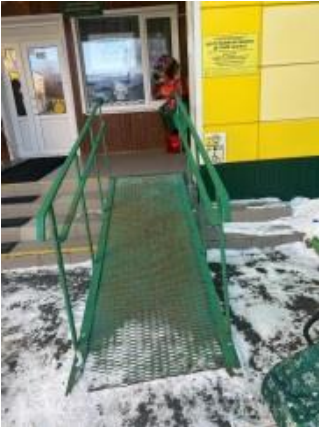
Вывеска с названием образовательного учреждения, местом его нахождения и графиком работы, выполненные рельефно-точечным шрифтом Брайля и на контрастном фоне. Ул. 40 лет Победы, 19а