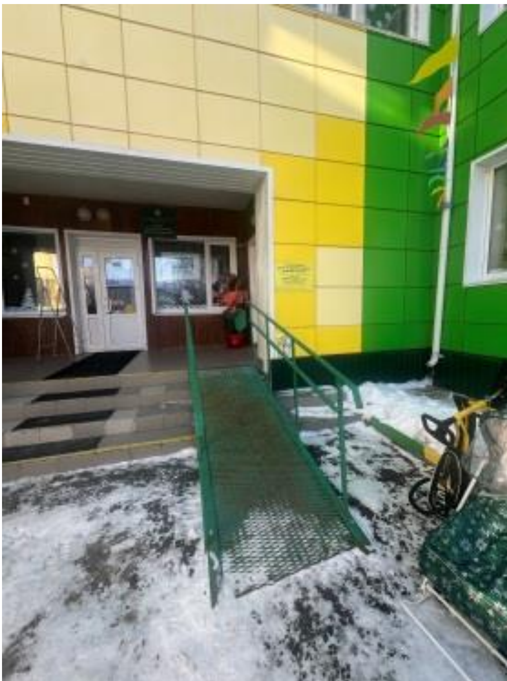
Пандус, кнопка вызова. Ул. 40 лет Победы 19а