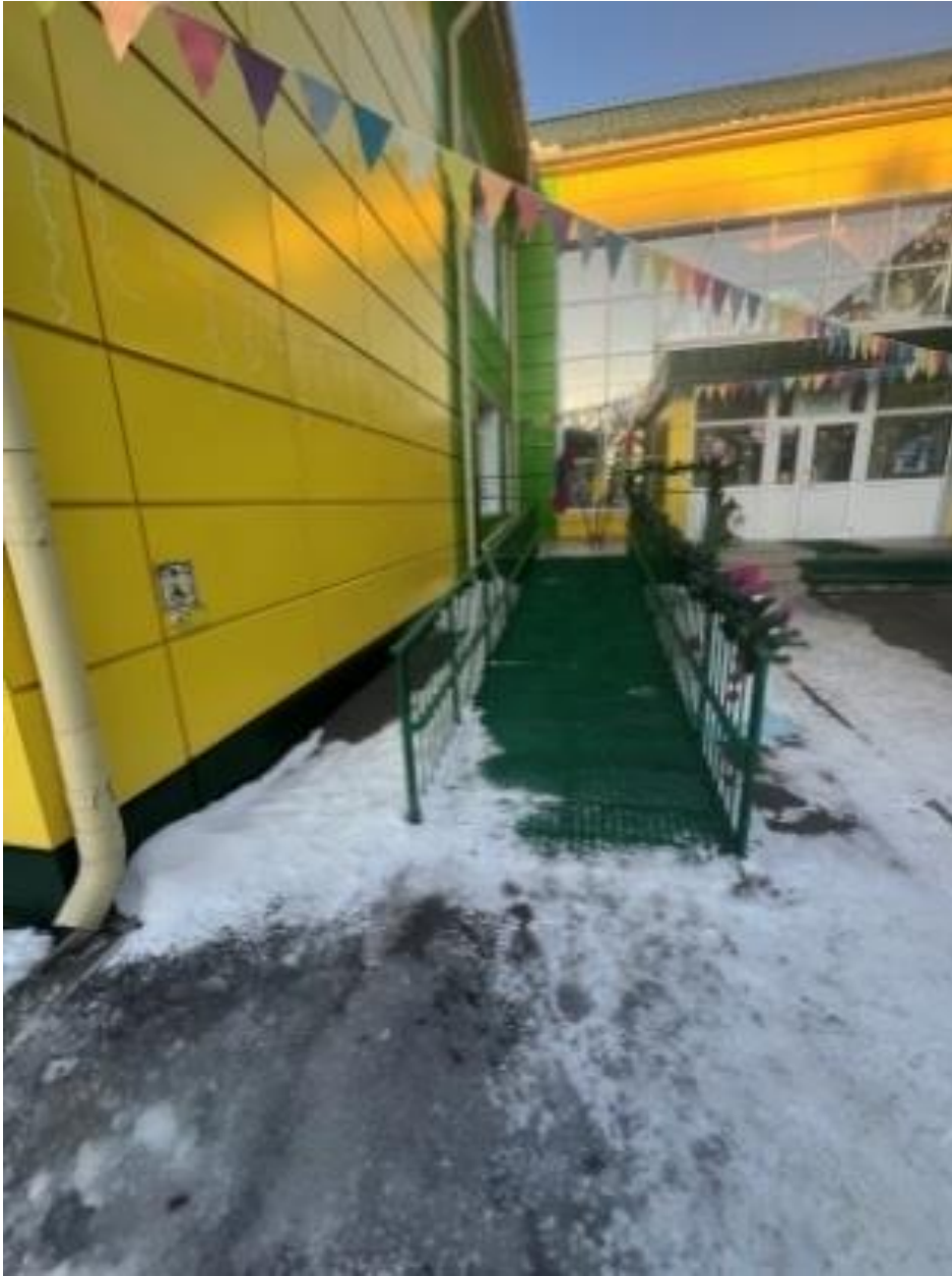
Пандус, кнопка вызова. Ул. 40 лет Победы 1а