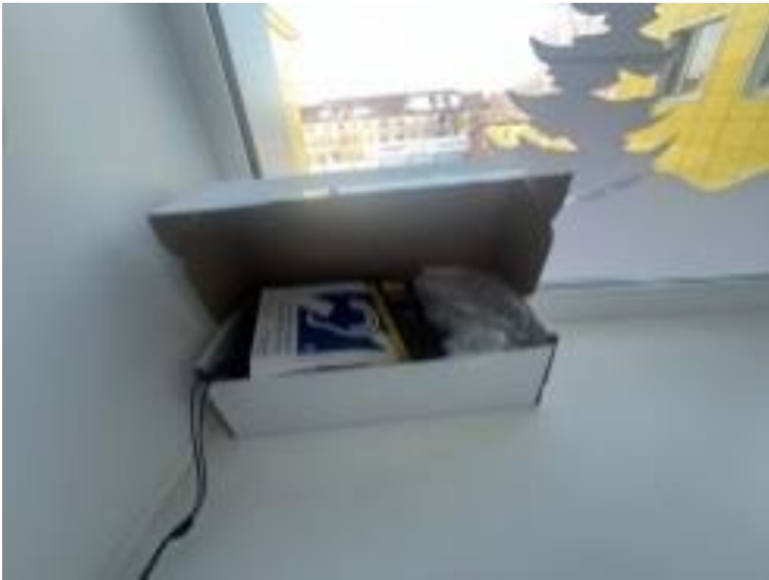
Индукционные петли и звукоусиливающая аппаратура. Ул. 40 лет Победы, 19а